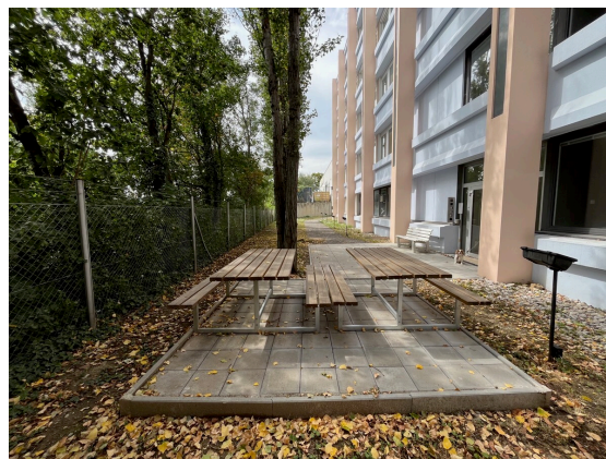
Außenbereich Foto 1