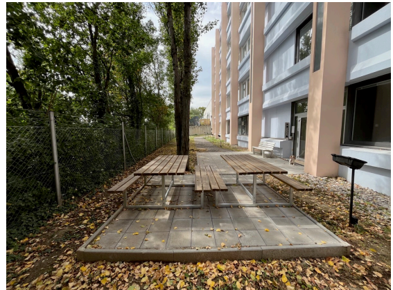
Außenbereich Foto 1